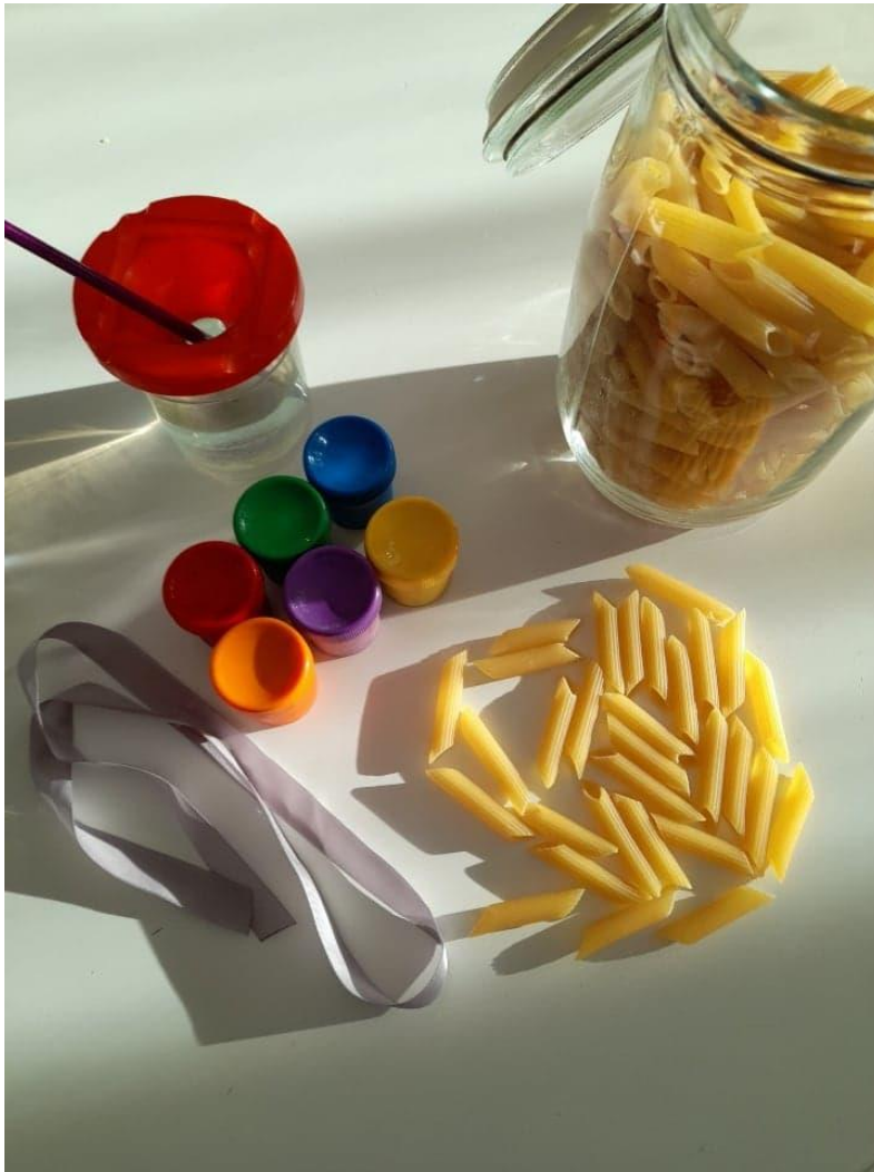
Zdjęcie 1: przygotowujemy makaron, wstążkę, farby, pojemnik z wodą i pędzelek.

Potrzebujemy: makaron rurki, farby plakatowe, pędzelek, wstążka lub sznurek Malujemy makaron, najlepiej najpierw po jednej stronie, a gdy wyschnie po drugiej. Używamy farb, które są kryjące, nie nadają się farby akwarelowe Nawlekamy na sznurek lub wstążkę, zawiązujemy i korale gotowe. Prawdziwy prezent dla każdej eleganckiej damy małej i dużej.