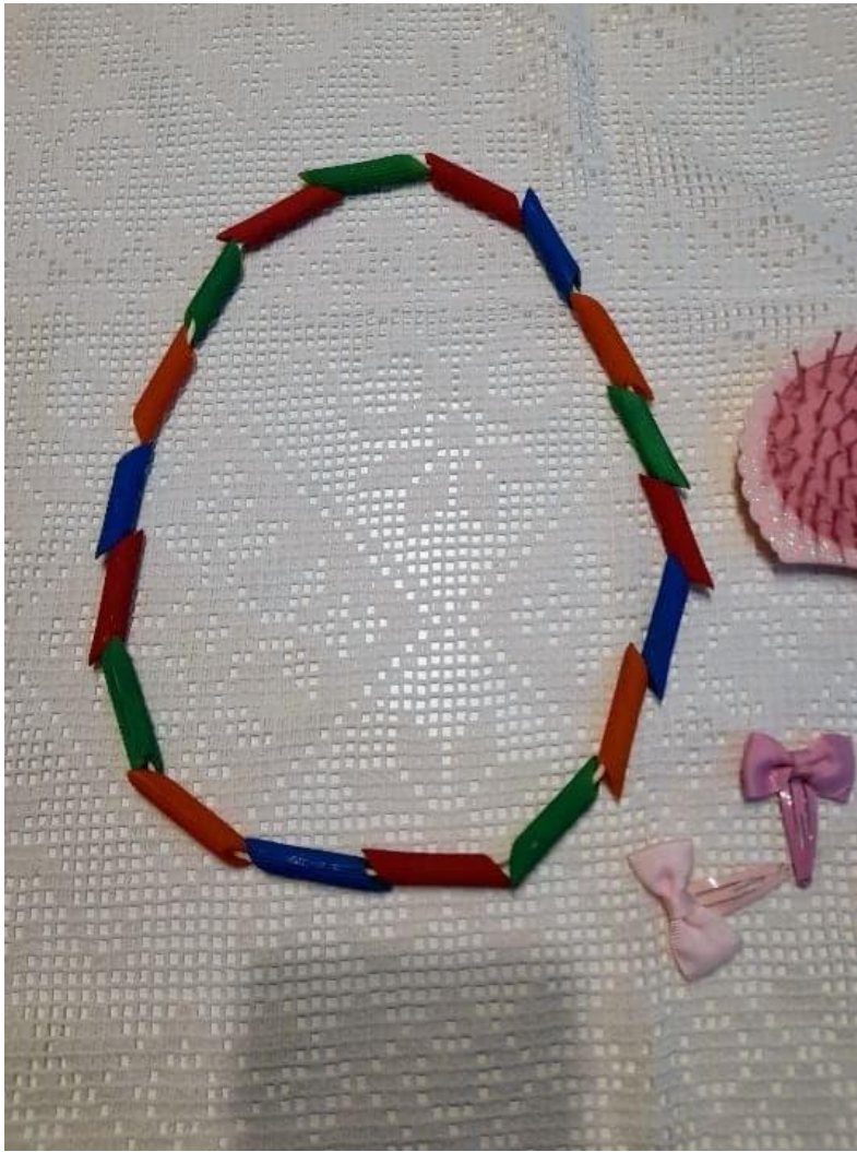
Zdjęcie 4: gotowe korale z makaronu.