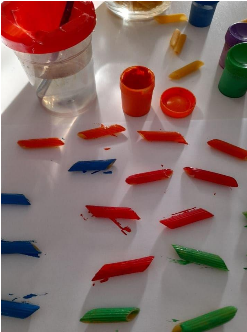
Zdjęcie 2: malujemy farbami makaron.